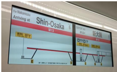
入駅前（停車中）イメージ